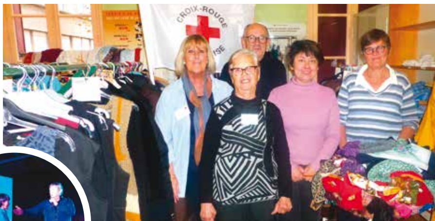
Des bénévoles de l'antenne locale de la Croix-Rouge. En médaillon: lors du spectacle de l'opération « Tous en fête ».

Toutes les associations caritatives se sont fédérées pour avoir une action forte et partager leurs compétences dans l'aide apportée aux gens. Ainsi, en créant cet